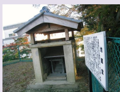
フェンスに囲まれた地蔵堂