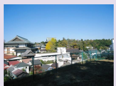
愛宕山から成田山を見る