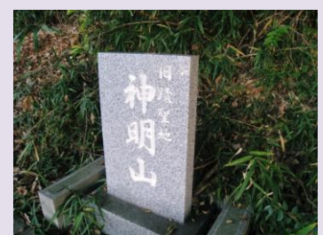
②石段右にある石碑