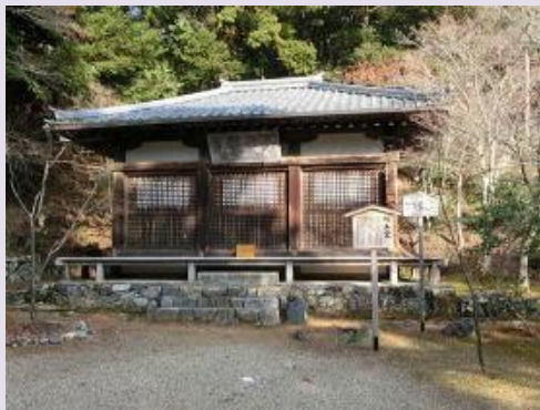
京都：高雄山神護寺明王堂

現在神護寺明王堂に安置されている不動明王像は、平安時代中期頃の作と考えられています。