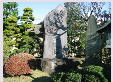
①米屋本店裏にある御不動様旧跡庭園