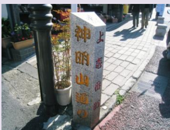
神明山通り入り口