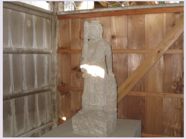
不動塚内の不動明王像（石造）